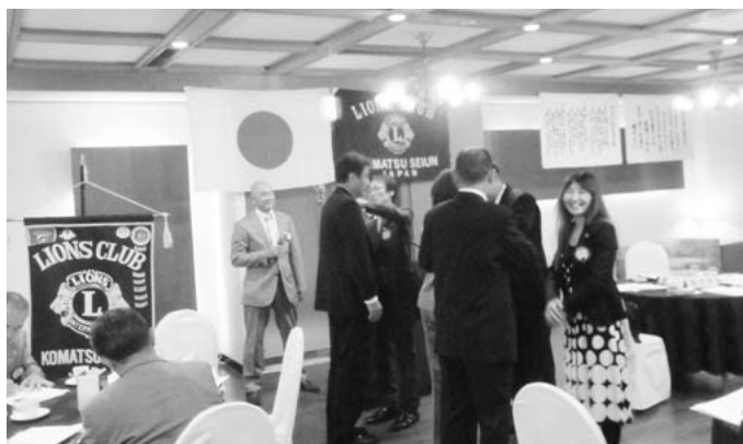
7月2日 396回例会 新旧三役 バッジ交換