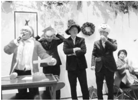
12月15日 407回例会 例会に引き続きクリスマス家族会