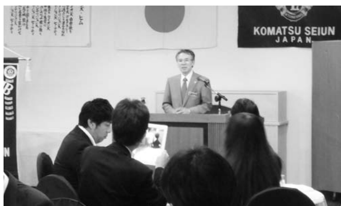
9月17日 土田ZC訪問例会