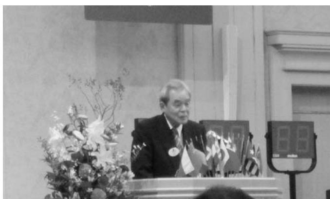
9月5日 400回例会 ガバナー公式訪問並びに4R1Z合同例会