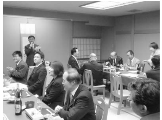
1月7日 408回例会 新年例会に引き続き新年懇親会