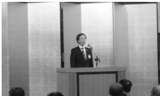
7月16日 397回例会 招待例会